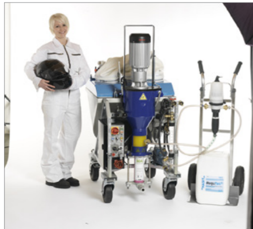
Bild aus Fotoshooting